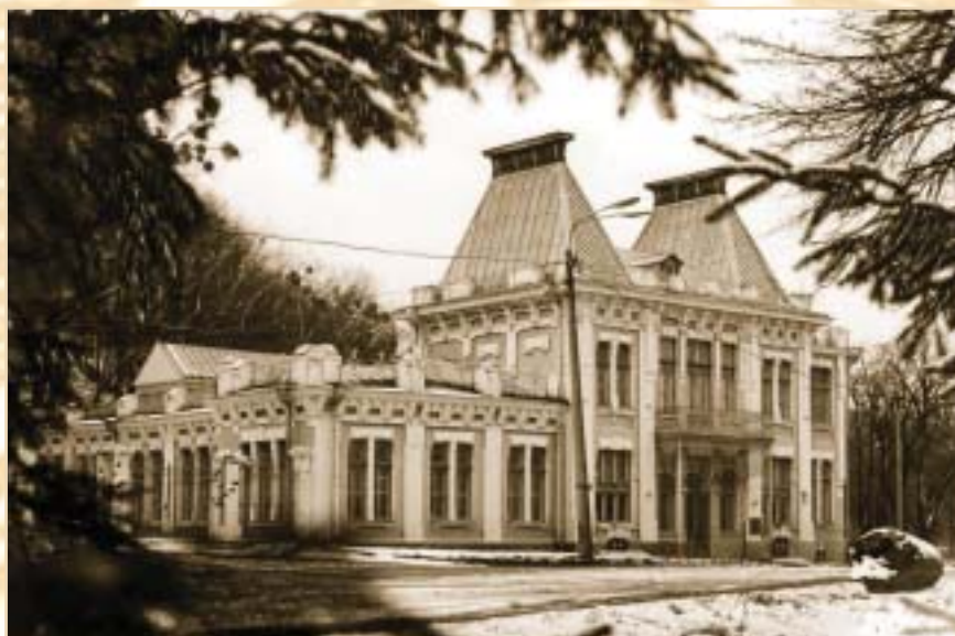
Бывшая больница Общества лечебниц для хронически больных детей. 1994 г.