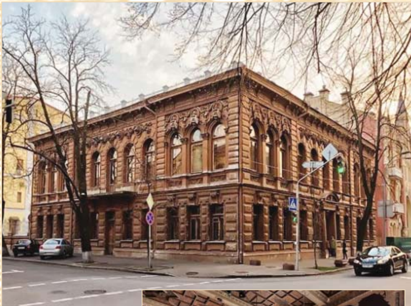
Шоколадный домик. 2013 г.

ника Юго-Западного края Ф. Ф. Трепова и др. С. С. Могилевцев израсходовал на его строительство 500 тыс. руб.