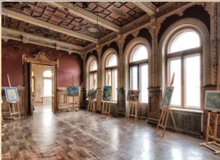
Один из залов Шоколадного домика. 2013 г.

Он умер 10 августа 1917 г. в своем особняке на углу улиц Левашовской и Елизаветинской (Шелковичная и Пилипа Орлика), который теперь известен киевлянам как «Шоколадный домик»,