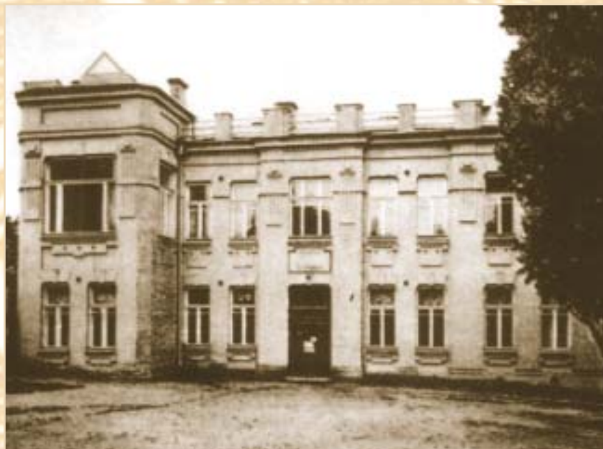
Больница на улице Лабораторной. 1910-е гг.

(Продолжение, начало в №№ 2 (43) – 4 (45) 2014 г.)