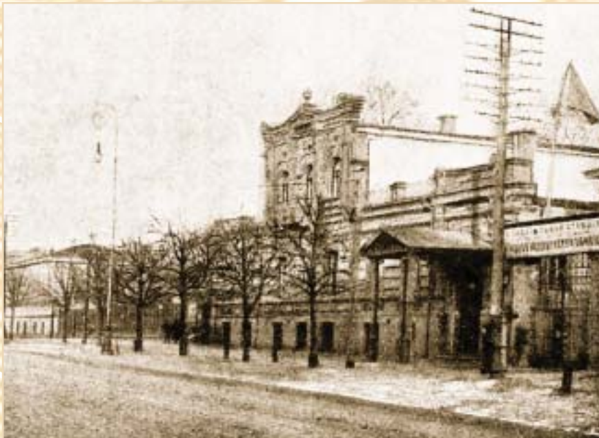
Спасательная станция Общества скорой медицинской помощи в г. Киеве. Улица Владимирская, 33. 1911 г.