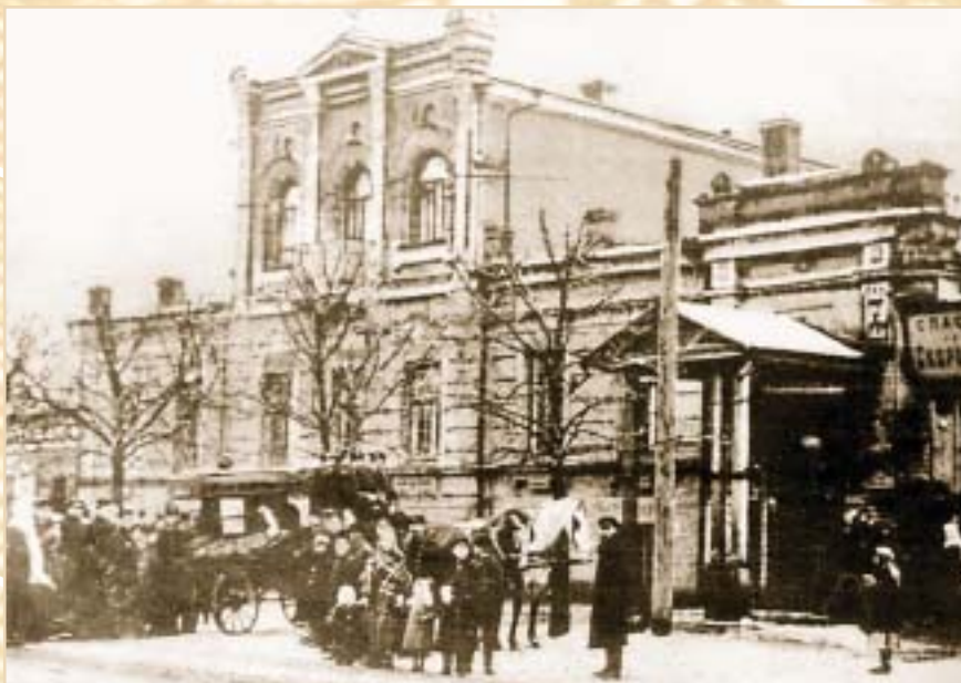
Станция «Скорой помощи» (ул. Владимирская, 33), 1909 г.