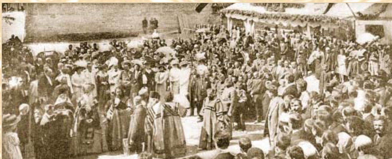
Закладка здания «Скорой помощи» 19 мая 1913 г.