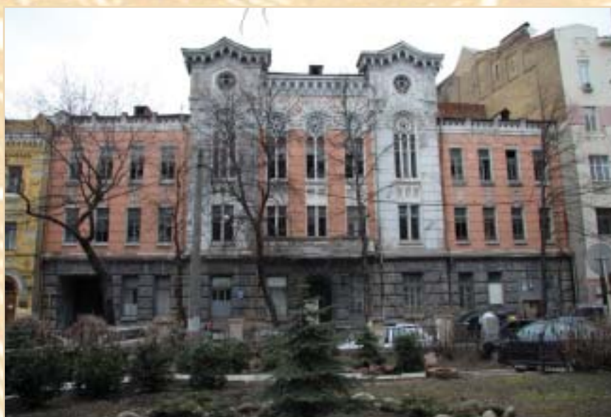
Киевский городской клинический эндокринологический центр (ул. Рейтарская, 22)