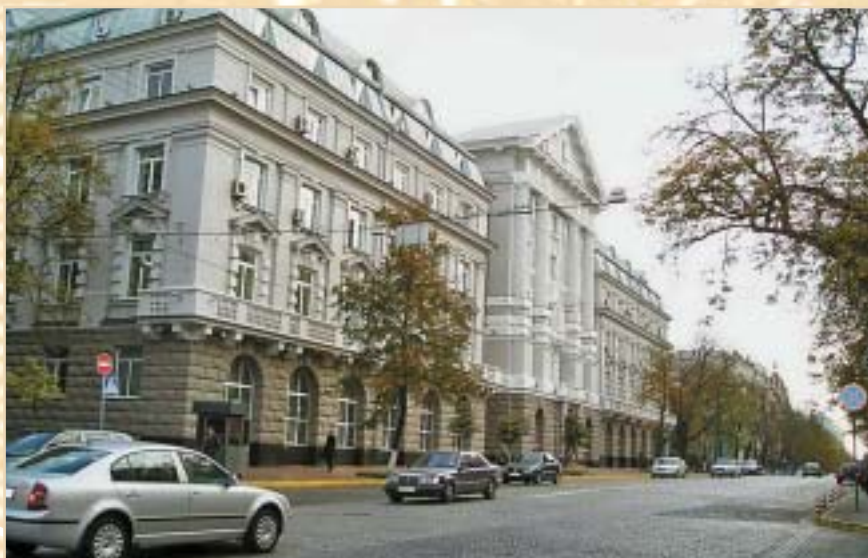
Здание Службы безопасности Украины (ул. Владимирская, 33)

Спасательной станции и различных фаз ее деятельности. Летом 1908 г. «Общество скорой помощи» выпустило в продажу специальные билеты ценой 1 руб., предъявителям которых некоторые магазины, поддерживая Общество, делали скидку, что давало ему определенный доход. Много полезного делал начавший действовать в 1908 г. Дамский комитет Общества, который организовывал пароходные гуляния, спектакли и другие приносящие доход мероприятия.