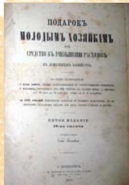
5-е издание. 1871 г.

невинной радостью здоровья и сознания прелести жизни.