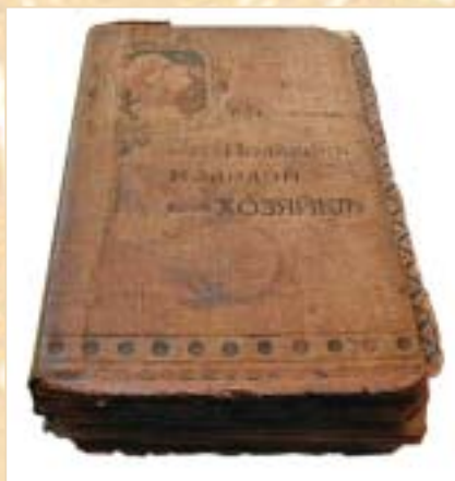
Одно из первых изданий Е. Молоховец

Составляя книгу, Молоховец преследовала, по ее словам, три цели. Во-первых, чтобы познать самих хозяек с кухней и вообще с хозяйством. Для этого она собрала описание разных необходимых в хозяйстве запасов: печенья, булок, сухарей, варенья, запасов овощей и фруктов, соленья, мяса, рыбы и прочего. Во-вторых, чтобы уменьшить расходы в домашних делах и научить хозяек самим выдавать провизию из