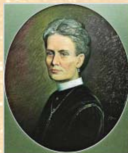
Е. И. Молоховец (1831 – 1918)

Этот город стал местом, где увидела свет знаменитая книга, хотя точные обстоятельства ее рождения отсутствуют, как нет и каких-либо черновых записей автора. Впрочем, книга не была первым сочинением Молоховец: таким значится