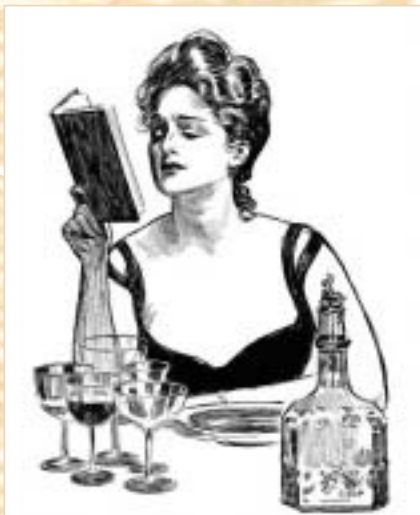
Портрет молодой женщины с поваренной книгой

С 1866 г. семья жила в Санкт-Петербурге. Здесь, воспитывая сыновей, ведя хозяйство и заботясь о муже, жена настойчиво работала над совершенствованием и переизданием своего «Подарка молодым хозяйкам». Его второе издание вышло здесь уже через год, в 1868-м. Одновременно книга начинает «толстеть» и вскоре состоит уже из двух томов, а в 1880 г. появляется третий.