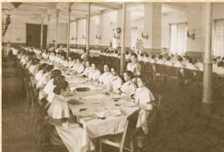
В столовой Смольного института

полька-мазурка «Раздумье», вышедшая в 1854 г. и продававшаяся по довольно высокой цене – 50 коп. Бытует версия, что сама Елена, собирая разные кулинарные рецепты и советы по хозяйству, и не думала об издании какого-либо сборника того, что накопила в своих тетрадках. Но любящий муж решил сделать жене подарок к именинам и в 1861 г. напечатал первое издание. Однако как объяснить наличие у него подготовленного материала для выпуска книги, если никаких записей Елены Ивановны не сохранилось, как и нет упоминаний в ее дневниках о происхождении рецептов. И еще: оказывается, рукопись книги предварительно была предъявлена цензурному комитету, который в августе 1860 г. ее одобрил.