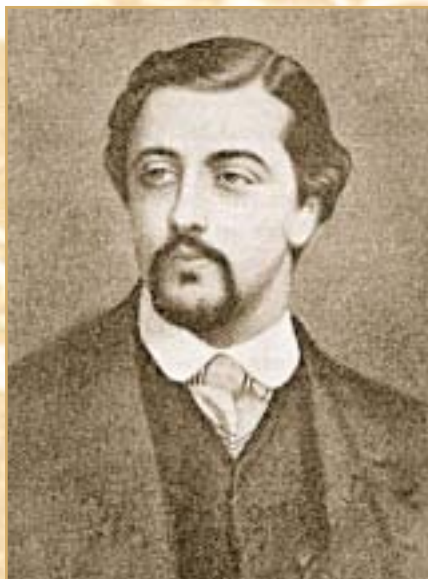
П. П. Демидов

шего. В одном лишь только можно упрекнуть г. Демидова – это в том, что он, будучи сам в высшей степени честным человеком, верил в честность других и безусловно доверялся окружающим его; между тем последствия доказали, что при нем созрели различные интриги, и он должен был оставить Киев, унося с собой самое невыгодное о нас мнение».