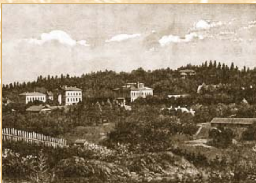
Старейшие корпуса Александровской больницы