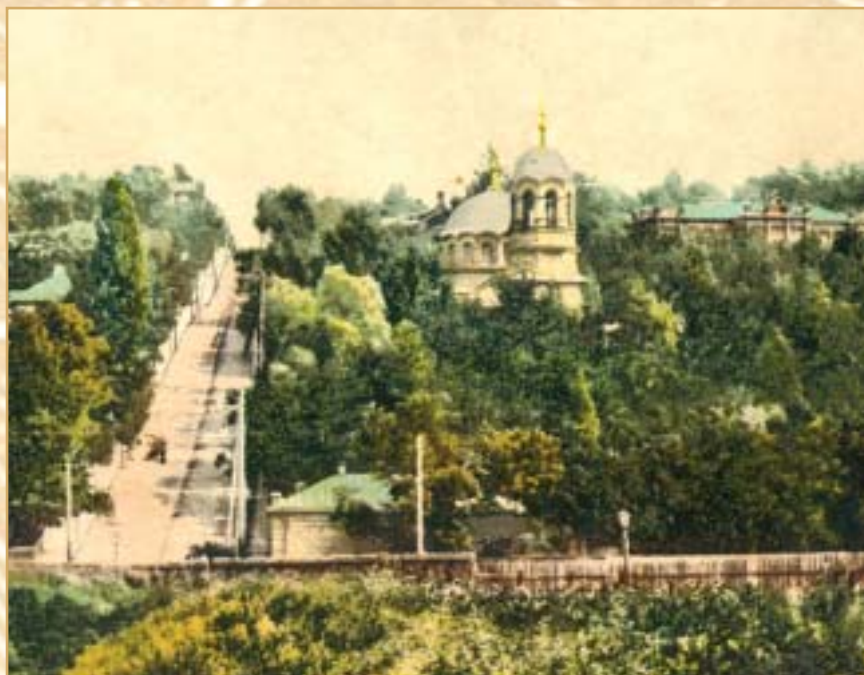
Александровская больница и Свято-Михайловская церковь. 1900-е гг.

Но вопрос затянулся настолько, что лишь в 1873 г. Городская дума определилась с местом строительства больницы – Кловским склоном, где когда-то располагались шелковичный и виноградный сады. Больница осталась по-