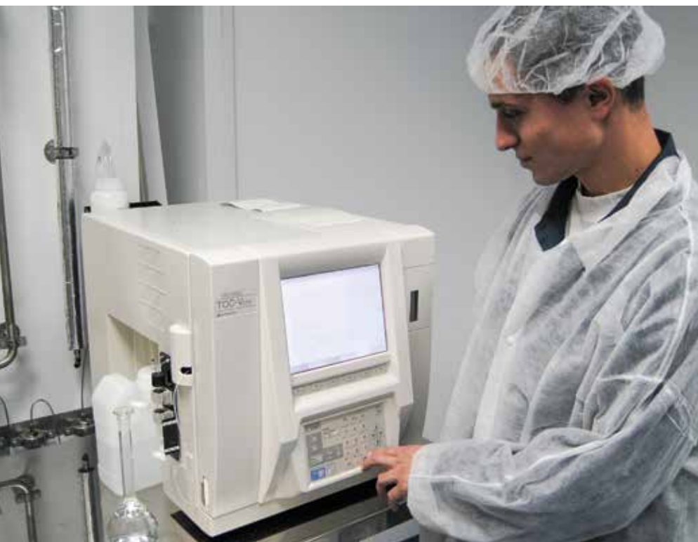
Фото № 2. Выполнение измерений на TOC-анализаторе модели ON-LINE TOC-V CSH производства корпорации SHIMADZU в лаборатории фармацевтического предприятия «Киевмедпрепарат»

ний, а именно: он не может быть использован для анализа проб с высоким содержанием TOC; для точного анализа природных вод, содержащих гуминовые соединения (трудно вскрываемые в реакторе второго типа); для определения общего азота, а также для анализа проб, содержащих взвешенные частицы (которые могут включать в себя часть общего органического углерода, содержащегося в пробе).