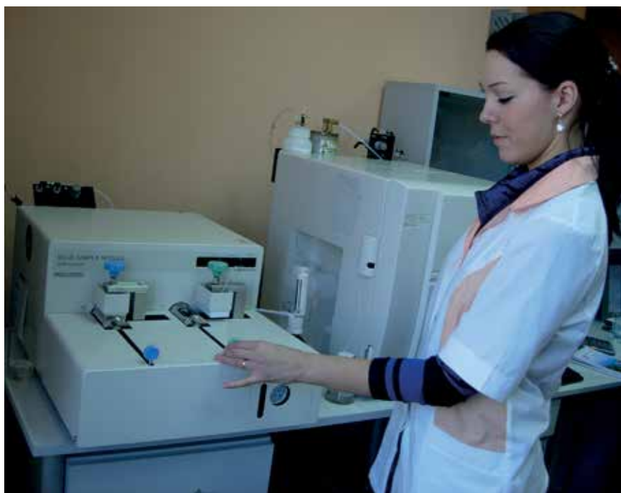
Фото № 3. Анализ твердых проб на комплексном TOC-анализаторе производства корпорации SHIMADZU, включающем приставку SSM-5000A

лишь появлением осадка солей в кристаллической форме, который можно легко смыть подкисленным раствором даже в автоматическом режиме. Это дает возможность использовать приборы серии TOC-L без замены катализатора в течение нескольких лет. Что же касается TOC-анализаторов, в которых применяется метод конверсии, сочетающий химическое окисление и УФ-облучение (эта серия приборов у корпорации SHIMADZU имеет аббревиатуру TOC-V W), то следует отметить одну важную особенность – эти приборы можно использовать для анализа проб воды особой чистоты (с содержанием TOC на уровне 0,5 мкг/л), что превышает возможности анализаторов серии TOC-L (нижний предел измерения которых составляет 4 мкг/л) за счет особенности процесса химического окисления, при котором реактор способен перерабатывать пробы воды, объем которых больше на порядок. Повышенную чувствительность анализаторов серии TOC-V W редко используют для контроля в фармацевтической отрасли, но она представляет большой интерес для