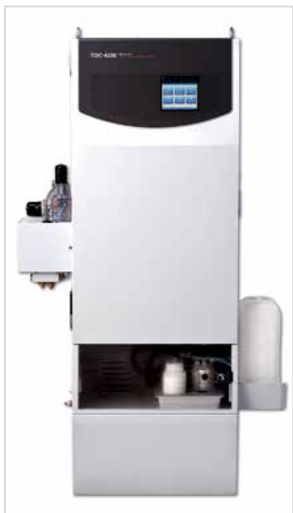
Фото № 4. Промышленный 6-канальный ТОС-анализатор модели ТОС-4200 производства корпорации SHIMADZU

электронной промышленности, а также для приборостроительных компаний, выпускающих аппараты для получения особо чистой воды.