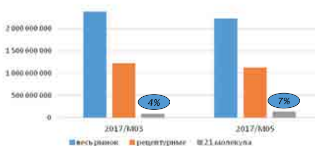
Рис. 5. Количество стандартных упаковок (таблеток, ампул), продающихся в аптеках Украины