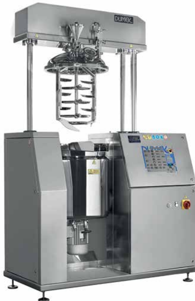
Вакуумный гомогенизатор TURBOMEK 200 производства подразделения Dumek – нового бренда в составе Marchesini Group

Машина оборудована датчиком нагрузки, который полностью интегрирован в подающую систему. Это техническая новинка, благодаря которой машина может производить до 400 упаковок в 1 мин, отличается большей компактностью в сравнении с