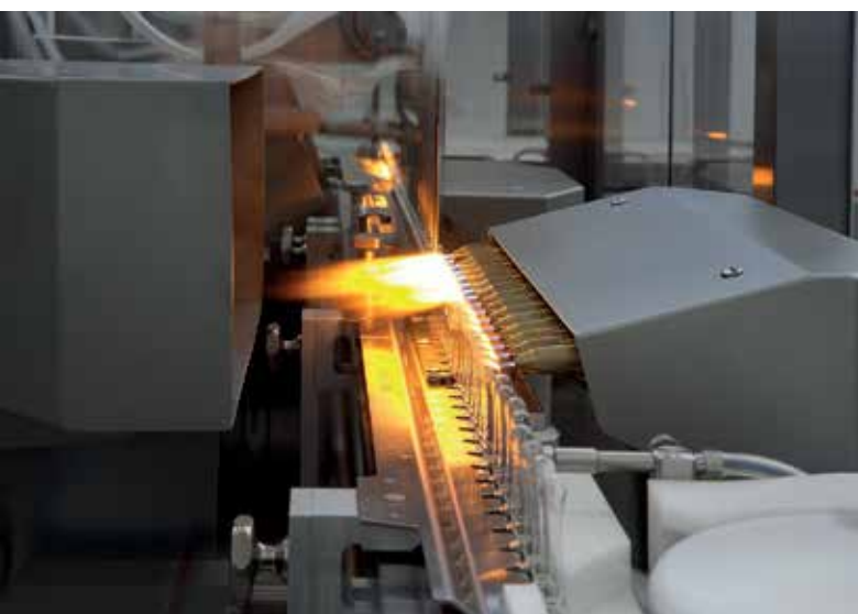
Ампульная машина RSF 24