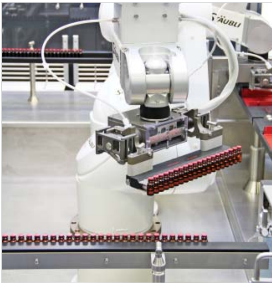
Роботизированная технология MAKR для накопления

стерильном розливе. Во время накопления она обеспечивает безопасную и быструю сортировку наполненных и укуренных флаконов на поддонах или кассетах, а также подачу на лиофильную сушку. Отлаженное действие рук робота позволяет производить манипуляции очень бережно. При этом исключается пролив жидких продуктов и тем самым значительно повышается безопасность производства.