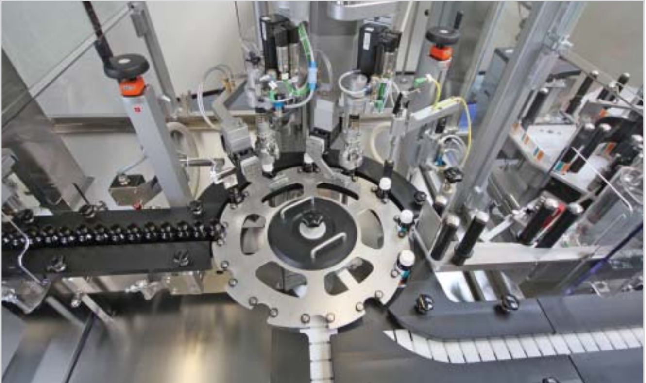
Машина MFCS-LR для розлива и укупорки товаров для здоровья