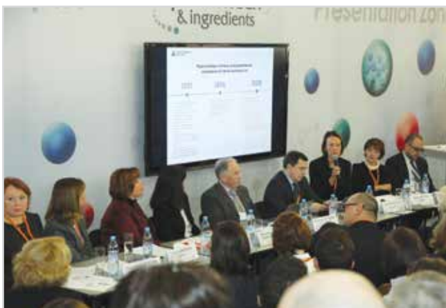
Заседание «круглого стола» на тему «Контрактное производство: практический опыт реализации. Взгляд двух сторон»

В 2015 г. фирмы Datwyler и «Эректон» отметили 20-летний юбилей сотрудничества (подробнее читайте в журнале «Фармацевтическая отрасль» № 6 (53), ноябрь 2015 г., стр. 80 – 83).