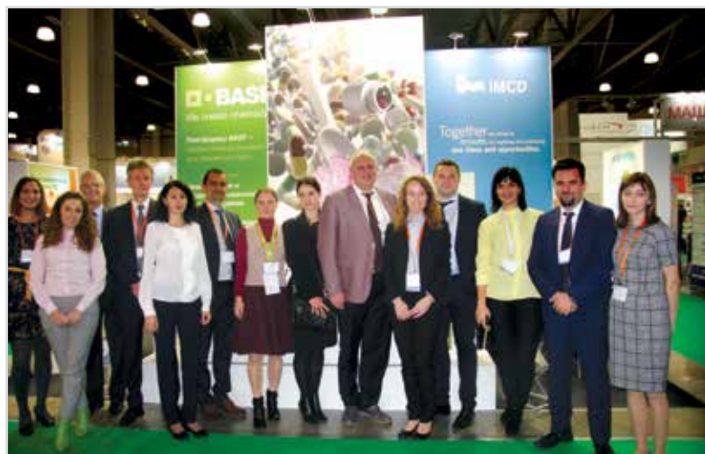
Совместный стенд ООО «ИМСД Рус» и «БАСФ» на выставке «Фармтех»

С 1 января 2015 г. ООО «ИМСД Рус» стало официальным дистрибьютором фармацевтической линейки «БАСФ» в России и некоторых странах СНГ. Совместное сотрудничество позволит обеспечить фармацевтические предприятия высококачественным сырьем и расширить географию его применения