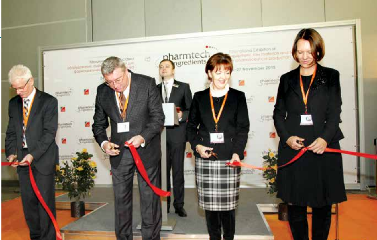
Торжественное открытие выставки «Фармтех»