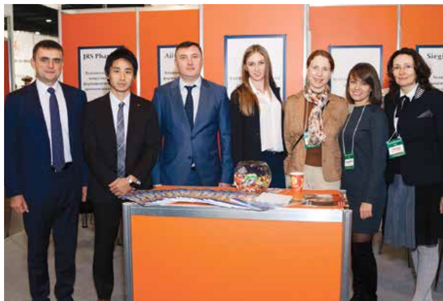
Сотрудники ТК «АВРОРА» с партнерами и клиентами