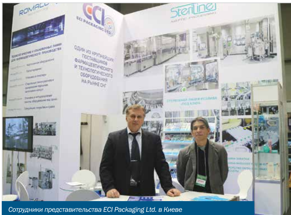
Сотрудники представительства ECI Packaging Ltd. в Киеве

«В первую очередь мы бы хотели поблагодарить организаторов за возможность принять участие в выставке PHARMATechExpo, а специализированный журнал «Фармацевтическая отрасль» – за выход статьи в номере, приуроченном к данному мероприятию. В этом году организация мероприятия нас очень порадовала: посетители стали более активными, а продукция, представленная компаниями, со-