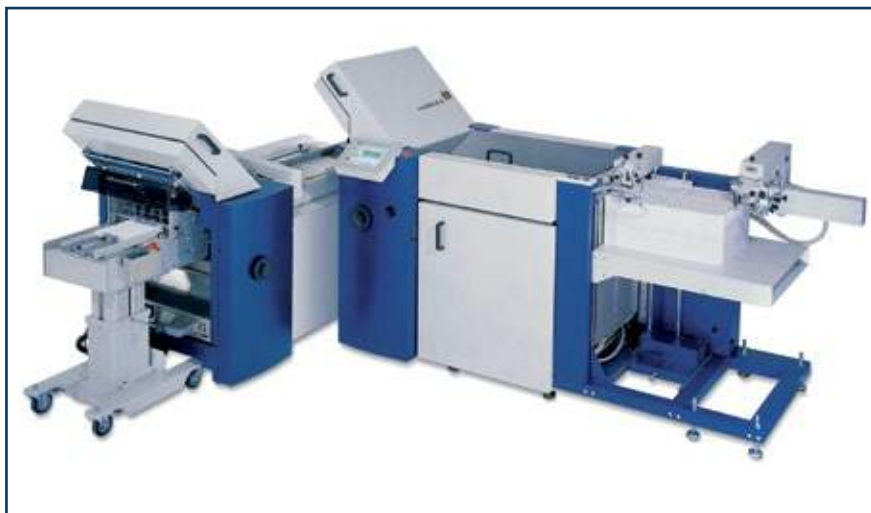
Машина для фальцовки медицинских инструкций prestige FOLD NET 52 4/4

Можно ли сфальцевать длинную инструкцию за один проход без предварительной фальцовки пополам? Может ли одна фальцевальная машина полностью удовлетворить все потребности фармацевтического завода в производстве инструкций? С оборудованием компании MB Bäuerle – это просто!