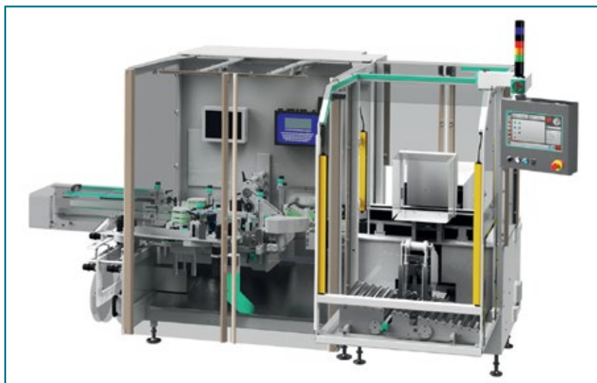
TRACK-PACK – моноблок непрерывного действия, состоящий из этикетировочной машины BL A415 и укладчика в короба PS 300

Долгожданной новинкой станет TRACK-PACK – моноблок непрерывного действия, состоящий из этикетировочной машины BL A415 и