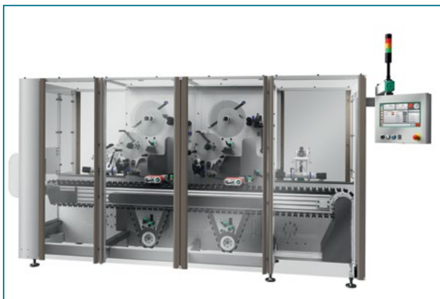
Этикетировочная машина BLH 235 способна наносить этикетки на продукты, расположенные на конвейере горизонтально

Еще одним инновационным решением, представленным Marchesini Group на выставке