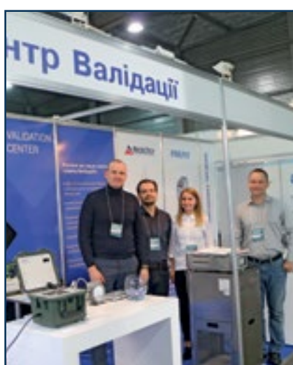
Коллектив компании «Центр валидации»