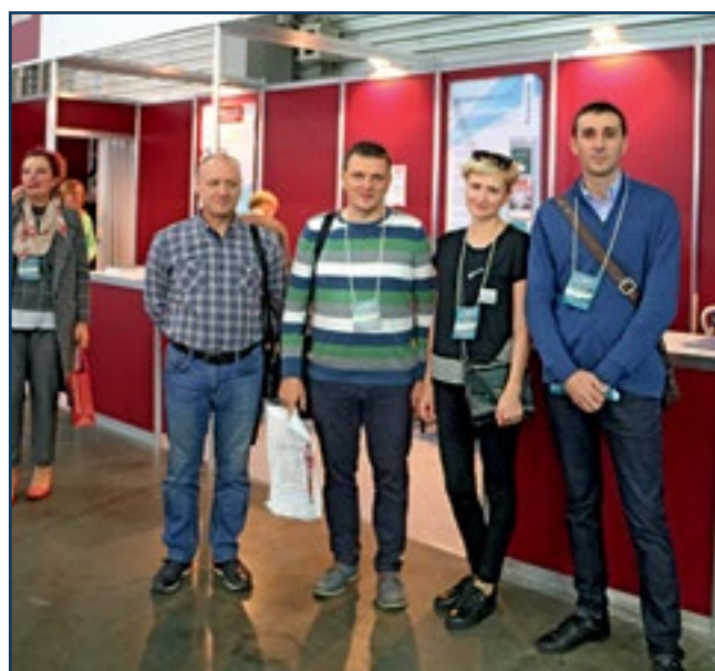
Стенд журнала «Фармацевтическая отрасль» посетили читатели журнала, работающие в фармкомпаниях «НПК «Экофарм», ОДО «ИнтерХим», ПАО НВЦ «Борщаговский ХФЗ», ДКП «Фармацевтическая фабрика» (г. Житомир) и др.