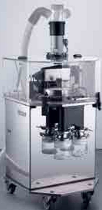
IPC 2- or 4-Parameter Tablet Tester

Сегментный пластиковый обеспыливатель таблеток с металлодетектором