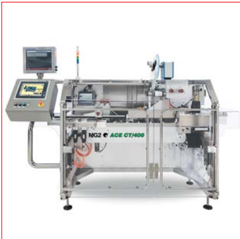
Модель ACE CT/400 для сериализации картонных пачек

MG2 возобновляет участие в выставке Pharmtech & Ingredients , что дает ей особую возможность продемонстрировать целевому рынку не только технологические ноу-хау, выделяющие эту итальянскую компанию, но и неизменное стремление к соответствию международным стандартам.