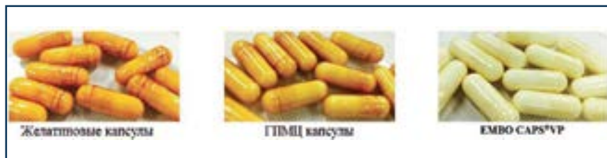
Рис. 4. Сравнительное исследование стабильности капсул с витамином С

могут стать причиной непривлекательного внешнего вида или потери инкапсулированной субстанции. Также ПЭГ придает желатиновым капсулам влагозащитные свойства и повышает их барьерные функции, позволяя фасовать гигроскопичные или влагочувствительные вещества.