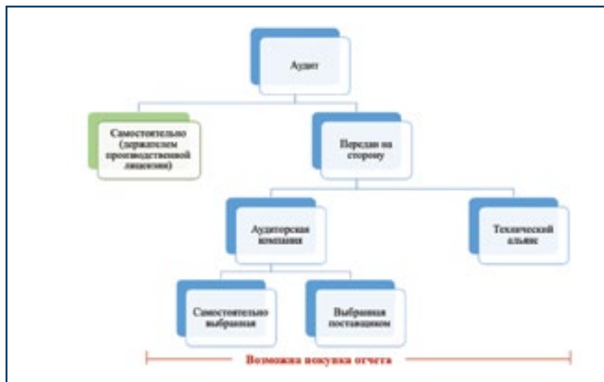
Рис. 6. Организации, которые могут проводить аудит поставщика

Результаты входного контроля подтверждают или опровергают гипотезу о соответствии качества закупаемого товара (соответствие спецификации), данные аудита – о соответствии нашим ожиданиям или требованиям, предъявляемым к качеству работы поставщика. Результаты аудита, подтверждающие соответствие поставщика, позволяют ослабить входной контроль закупаемого у него товара и даже отказаться от проведения аудита, доверяя результатам контроля у поставщика. Это подтверждается пунктом 5.35 Части 1 GMP: «... производители готовой продукции могут использовать частично или полностью результаты испытаний утвержденного производителя исходных материалов, но должны как минимум выполнять испытание на подлинность каждой серии в соответствии с приложением 8 GMP». Однако для этого необходимо выполнить ряд условий, заявленных в пункте 5.36 Части 1 GMP: «... для передачи испытаний сторонней организации должны быть соблюдены следующие требования: (i) особое внимание следует уделять контролю за распределением (транспортированием, дистрибуцией, хранением и поставкой) сырья в целях обеспечения того, чтобы ре-