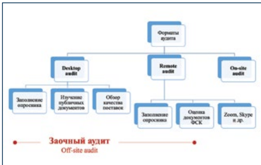
Рис. 3. Форматы аудита поставщика

Кто проводит аудит? Аудит может быть проведен самостоятельно держателем производственной лицензии либо через лицо (организацию), действующее от его имени по контракту (рис. 6). И как раз вопрос для всех, кто отрицает возможность за-