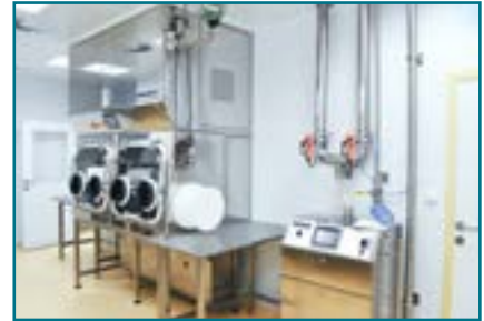
Изоляторная технология BLOCK®. Генератор пара перекиси водорода BLOCK®

Мы разрабатываем, выпускаем и поставляем мебель, технологическое оборудование и аксессуары, с помощью которых можно комплектовать и оборудовать лабораторные помещения с учетом самых разнообразных требований, предъявляемых к эксплуатации. Все лабораторные элементы совместимы с системами встраиваемых «чистых помещений», что позволяет осуществлять комплексное строительство всех типов защищаемых лабораторий. Например, лабораторные столы и вытяжные шкафы. Их производство осуществляется на заводе KÖTTERMANN в Германии.