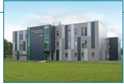
BLOCK® – Реализация «под ключ»