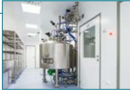
«Чистые помещения» BLOCK®