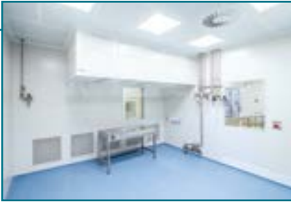
«Чистые помещения» BLOCK®