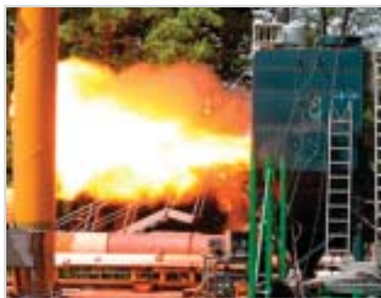
Взорвавшаяся пылеуловительная камера может вызвать серьезные повреждения у рабочих или привести к их смерти

Он присоединился к Camfil APC в 2013 г., а сейчас отвечает за продажи пылеуловительного оборудования для фармацевтической промышленности в Европе и на рынках соседних стран.