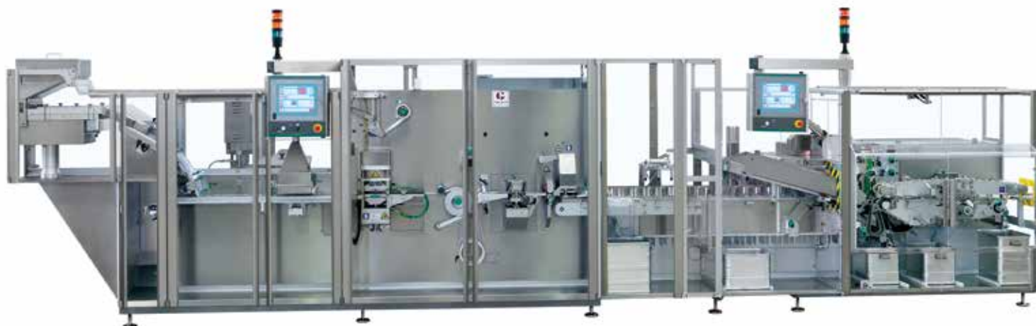
Комплексная роботизированная блистерная линия Integra 220