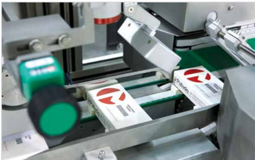
Модель BL A420 – машина для нанесения стикеров на пачки для Track & Trace

На выставке Pharmintech представленная Integra 220 будет комплектоваться обандероливающей машиной Multipack FA 04, балконный дизайн которой обеспечивает доступ оператора ко всем рабочим станциям. Машина является предельно простой в использовании.