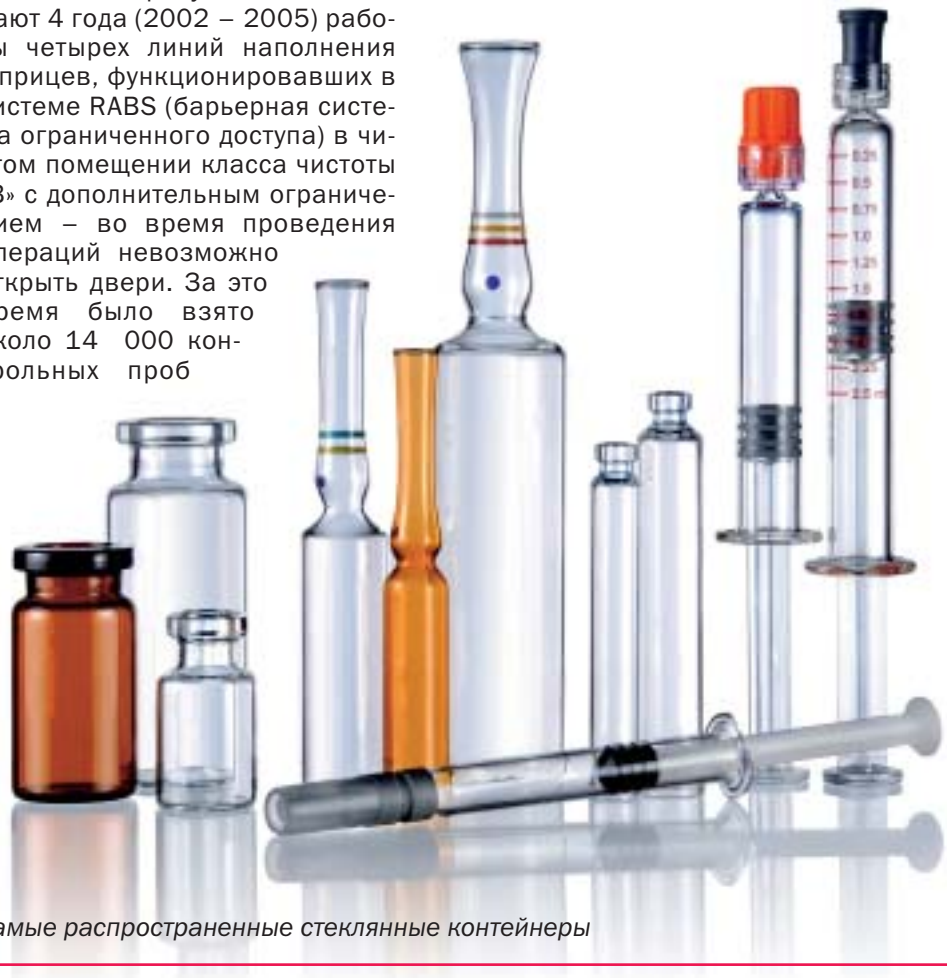
Самые распространенные стеклянные контейнеры

Если предположить, что такой уровень отклонения является репрезентативным для процесса асептического розлива в системе RABS, то можно подсчитать, что в каждом 5000 \text{ м}^3 воздуха содержится 1 КОЕ. Риск загрязнения каждого типа контейнера по результатам таких подсчетов представлен на рисунке, из которого видно, что риск загрязнения предварительно наполненных шприцев составляет примерно один контейнер на миллион. Эта величина согласуется с данными media fill теста, которые представила компания Vetter на конференции ISPE в г. Тампа. Сообщалось, что с использованием четырех линий оборудования, защищенных си-