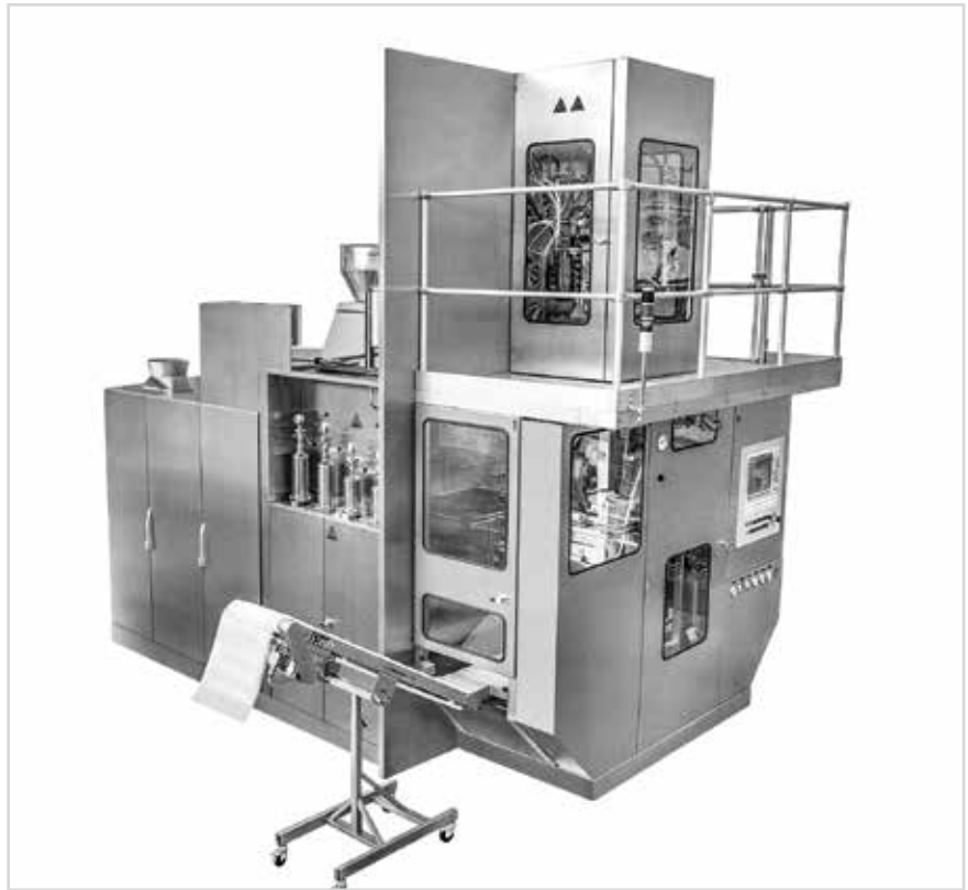
Ротационная установка bottelpack bp460 для асептической упаковки

После проверки совместимости необходимо осуществить испытание продукта с помощью технологии BFS. Данную услугу предоставляет производитель-субподрядчик (Contract Manufacturer – СМО). На предприятиях субподрядчиков компании Rommelag в Германии и Швейцарии имеются ресурсы для тестирования широкого спектра фармацевтической и биотехнологической продукции, включая инъекционные ингаляционные препараты и лекар-