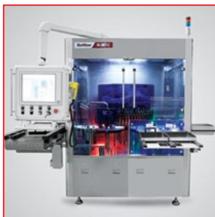
Инспекционная машина для ампул