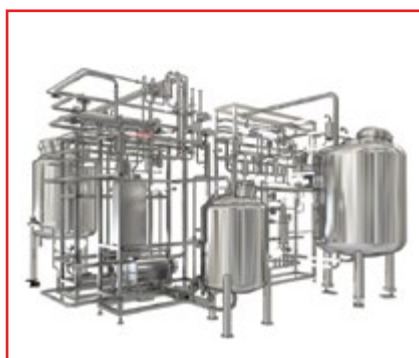
Автоматическая система приготовления растворов