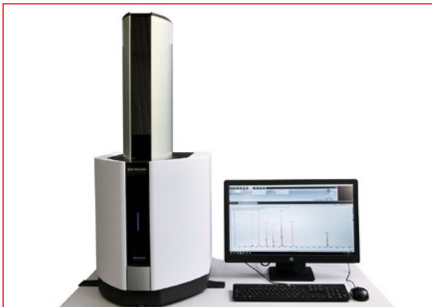
Фото № 5. MALDI-TOF масс-спектрометр модели MALDI-8020

FWHM; чувствительность – 250 аттомоль для пептидов и 250 фмоль для белков; максимальная частота лазерных импульсов – 200 Гц; длина волны излучения твердотельного лазера – 355 нм. Привлекательной эксплуатационной характеристикой этого прибора является его бесшумная работа (< 55 дБ), что наряду с компактной настольной конструкцией делает удобным его использование в любых лабораторных условиях. ■