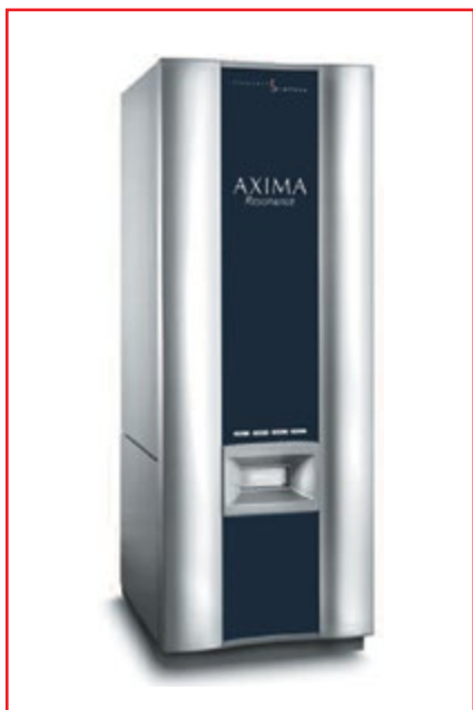
Фото № 2. MALDI-TOF масс-спектрометр модели AXIMA Resonance

масс-анализатор линейного типа. Диапазон измеряемых масс составляет от 1 до 500000 Да, разрешение – более 5000 FWHM, чувствительность (Glu-1-Fibrinopeptide) – 0,25 фмоль, максимальная частота «выстрелов» лазера – 50 Гц. Прибор оснащен полностью автоматической системой ввода пробы. Кроме того, использован держатель для нескольких планшетов специальной формы с общим числом лунок 384. Программное обеспечение управляет перемещением столика таким образом, чтобы проба точно подстраивалась под фокус лазера.