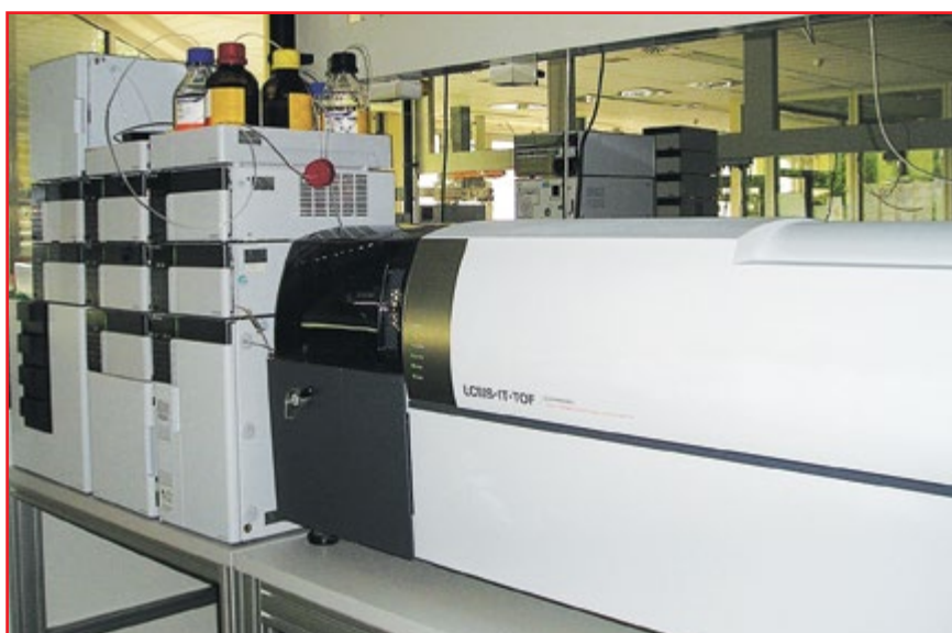
Фото № 1. Жидкостный хромато-масс-спектрометр модели LCMS-IT-TOF

Одной из самых важных задач, стоящих перед сотрудниками исследовательских лабораторий фармацевтической отрасли, является установление формулы органического соединения и его структуры. Надежное и быстрое решение этой задачи обеспечивается благодаря использованию жидкостного хромато-масс-спектрометра LCMS-IT-TOF (фото № 1), представляющего собой гибридную систему, в состав которой входят квадрупольная ионная ловушка (QIT) и времяпролетный масс-анализатор (TOF) с двухступенчатым рефлектроном (DSR). В этом приборе используются традиционные для жидкостной хромато-масс-спектрометрии режимы ионизации – электроспрей (ESI), а также химическая ионизация при атмосферном давлении (APCI) и фотоионизация при атмосферном давлении (APPI). Прибор обладает высоким разрешением ( R > 10000 FWHM). Его принципиальное отличие от других гибридных конструкций масс-спектрометров типа Q-TOF состоит в том, что он позволяет использовать не только режимы MS и MS / MS, но также MS / MS / MS и последующие режимы выделения ионов вплоть до MS10. Именно благодаря этому эффективно решается задача установления структуры органического соединения. При работе на данном приборе кроме основ-