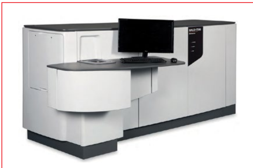
Фото № 4. MALDI-TOF-TOF масс-спектрометр модели MALDI-7090

Самой новой разработкой корпорации SHIMADZU в области времяпролетной масс-спектрометрии является настольный вариант MALDI-TOF масс-спектрометра с новым твердотельным лазером. Этот прибор модели MALDI-8020 (фото № 5), так же как модель AXIMA Assurance (см. выше), имеет масс-анализатор линейного типа и обладает следующими основными техническими характеристиками: диапазон масс составляет 1 – 500000 Да; разрешение – > 5000