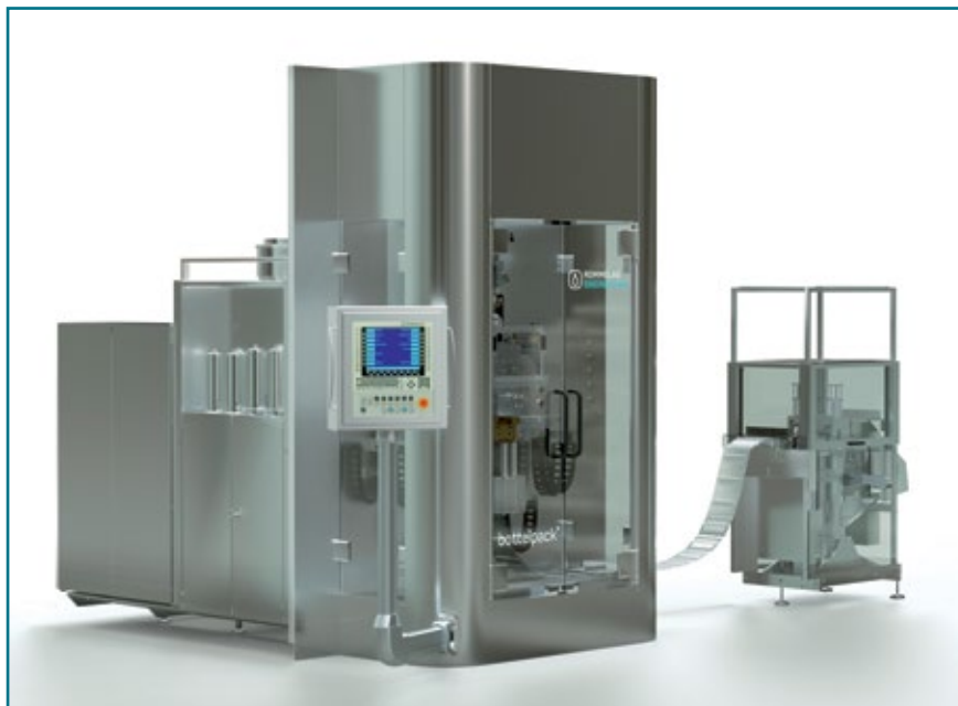
Асептическая машина для наполнения bottelpack bp434

Компания Rommelag предлагает различные виды оборудования для обеспечения качества фармацевтической продукции. В области автоматической визуальной инспекции представлен широкий спектр оборудования – от контроля кос-