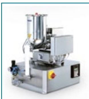
Устройство дозирования и подачи стеарата магния PKB-II