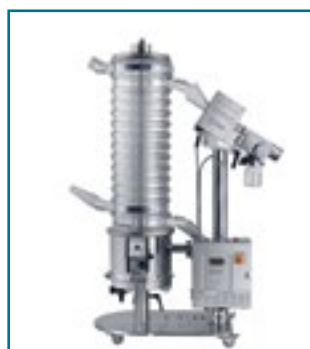
Обеспыливатели и металлодетекторы Ecpo flex