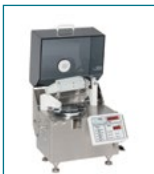
Система контроля веса таблеток Weightmaster 6.2