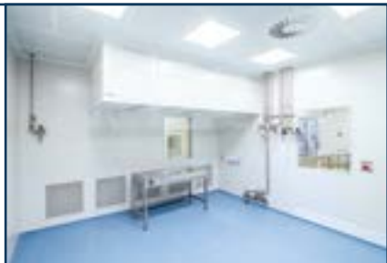
«Чистые помещения» BLOCK®