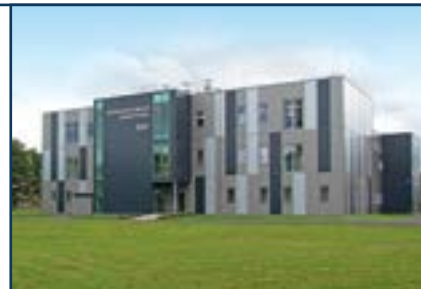
BLOCK® - Реализация «под ключ»

пользуем EASY TO ASSEMBLY trend – тренд ПРОСТОГО МОНТАЖА, благодаря чему можно создавать любые помещения высшего качества на заказ в зависимости от нужд производственного процесса.