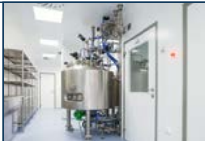
«Чистые помещения» BLOCK®