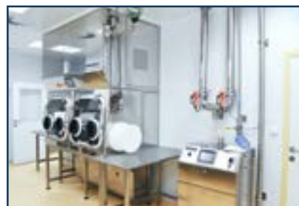
Изоляторная технология BLOCK®. Генератор пара перекиси водорода BLOCK®

На заводе For Clean в Словакии мы выпускаем мебель из нержавеющей стали марок AISI 304 / AISI 316 L.