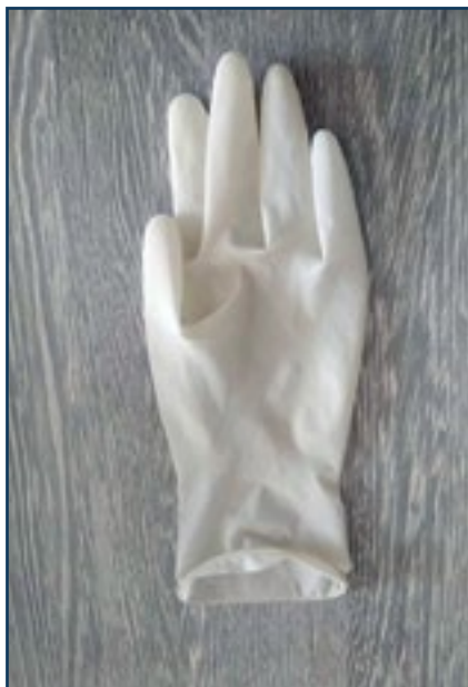
Образец готовой продукции

ная мощность линии составляет 25 – 35 шт./мин. Также компания «Кено Фарма» наладила поставки сырья на предприятие заказчика.