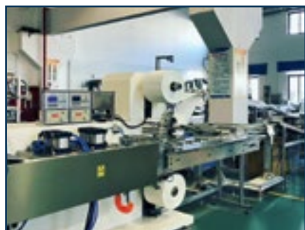
Оборудование упаковки латексных перчаток

Китай, г. Пекин, р-н Чаоянг, ул. Цзя Тай, Международный особняк, здание А, офис 1925 Тел.: +8610 857-104-56 Факс: +8610 857-114-36 E-mail: keno@kenopharma.com www.kenopharma.com Хэш-тэг в соц. сетях: keno_pharma