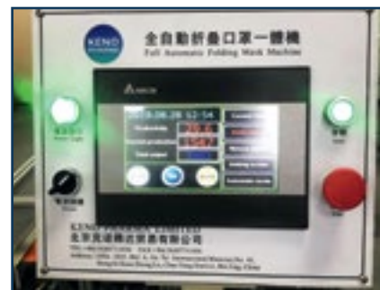
Контроль-панель оборудования изготовления масок