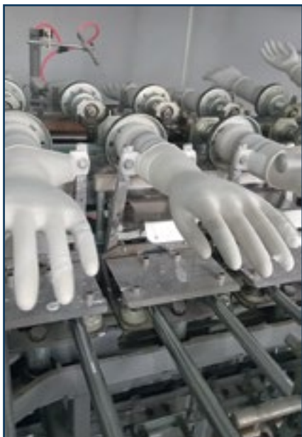
Производство латексных перчаток