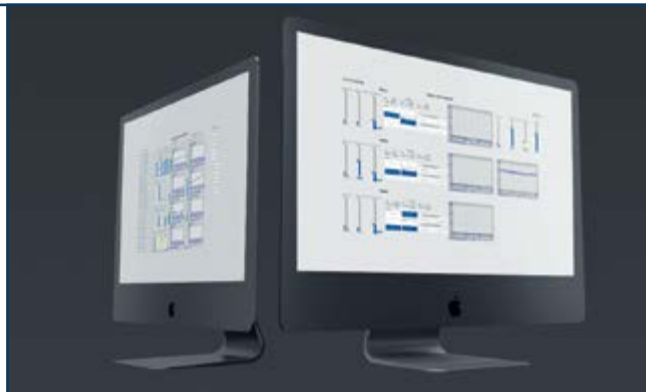
Екрани перегляду послідовності подій та даних по партіях Деякі з екранів диспетчерської системи

Як було зазначено вище, системи, подібні до АСОДУ (автоматизовані системи оперативно-диспетчерського управління, як low-end сегмент у категорії MOM-систем), давно відомі на ринку. Водночас якість цих систем далеко не завжди задовольняє замовника. Наприклад, на підприємстві «Юрія-Фарм» низова автоматика включає велику кількість контролерів від різних виробників – Siemens, Vipa, Omron, Owen та ін. Проблема полягала у тому, що логіка цих контролерів вирішує завдання тільки безпосереднього керування машиною. Розробники машин не передбачали, що дані про роботу основних вузлів, параметри продуктивності, помилки системи та інше будуть комусь необхідні. Тому головне завдання полягало у виділенні корисної інформації та тлумаченні існуючих даних. Наприклад, замовник поставив завдання, щоб причини простоїв визначались автоматичним способом. Але як це зробити, коли система керування машиною генерує масу непрозорих помилок, які важко інтерпретувати?