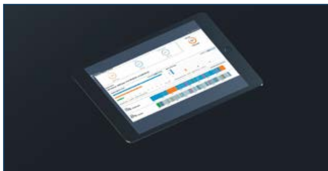
Складова ЗЕО доступність