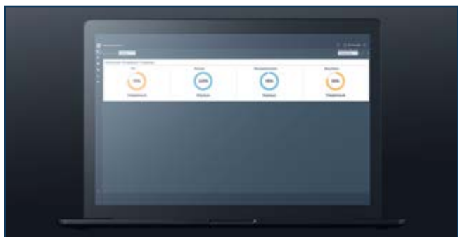
Узагальнений екран ЗЕО ПО лінії, яка складається з двох юнітів

«Проблематика підприємства «Юрія-Фарм» була досить знайомою для нас. Ми спеціалізуємось на подібних завданнях з диспетчеризації та обліку КРЕ вже більше 15 років. У даному випадку ми відразу побачили, що однією з головних причин недостатньо ефективного обліку ЗЕО було ручне введення даних. Власне, на це вказував і замовник»