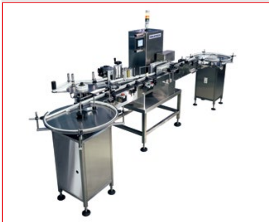
Рис. 1. Автомат нанесения этикеток ROLS-300 для флаконов

ровочных машин ROLSTECH для флаконов и картриджей.