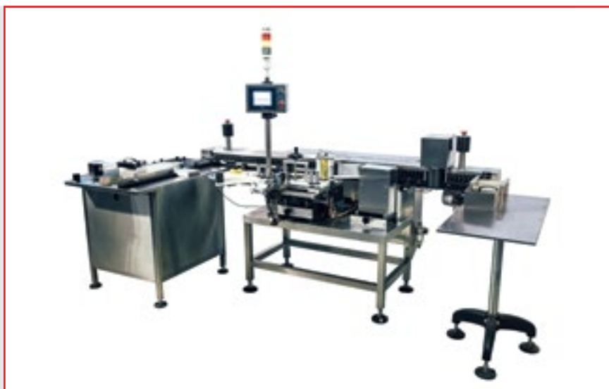
Рис. 2. Автомат нанесения этикеток ROLS-300A для флаконов, ампул и картриджей

Автоматы нанесения этикеток ROLS-300 и ROLS-300A уже давно зарекомендовали себя как надежное оборудование и имеют европейский сертификат соответствия CE. Всего на ведущих предприятиях России, Украины и Беларуси задействовано почти полсотни таких машин. В частности, на заводах ГК «Фармасинтез» в Иркутске и Санкт-Петербурге с 2018 г. работают несколько высокоскоростных этикетки-