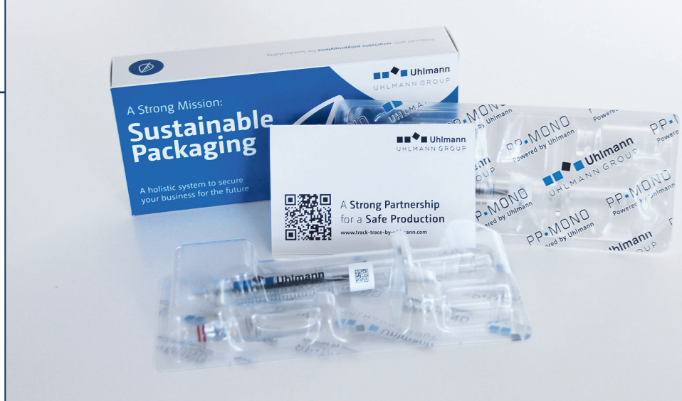
Фото 6. Система від Uhlmann дозволяє переходити від класичних блістерів з ПВХ до більш екологічно чистої одноматеріальної упаковки з ПЕ

Програмні рішення, які збирають дані на кожному з етапів ланцюжка поставок фармацевтичних препаратів, також гарантують більшу безпеку. За допомогою програмної платформи Rexcite від Uhlmann Pac-Systeme користувачі можуть збирати, порівнювати, відображати та аналізувати інформацію з усіх ділянок процесу виробництва та пакування, таким чином виконуючи різні завдання за потреби: реалізація специфікацій відстеження та контроль на кожному з етапів ланцюжка поставок, моніторинг продуктивності машин і процесів, цифрове управління інструментами або централізований контроль і управління всіма виробничими процесами. Платформу можна використовувати на всіх цифрових пристроях, таких як настільні пристрої, планшети та смартфони. Директор з розвитку та експлуатації цифрових рішень компанії Uhlmann Pac-Systeme Томас Кройтл зазначає: «Візуально привабливий дизайн, легкий, зручний зовнішній вигляд означають насамперед спрощення для спеціалістів, які використовують Rexcite. Ця програмна платформа здобула нагороду Red Dot Award 2022».