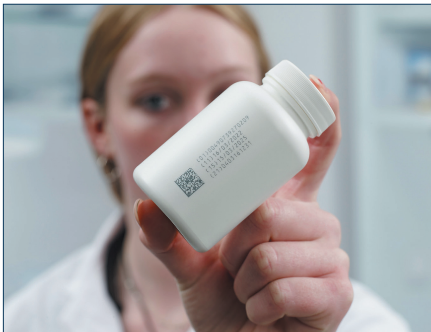
Фото 5. Лазер для УФ-маркування Domino U510 не використовує пігменти/добавки для самоактивації або спеціально підготовлені поля для маркування за рахунок фотохімічної реакції

Наповнення рідких фармацевтичних препаратів вимагає спеціального застосування ноу-хау технологій. Для цього компанія Syntegon розробила Versynta FFP (гнучку платформу для наповнення), модульну машину з індивідуальним налаштуванням, спеціально призначену для асептичного наповнення невеликих партій. Нове рішення для розливу забезпечує продуктивність до 3600 флаконів, шприців або картриджів за 1 год при одночасному 100-відсотковому контролі процесу. Платформа включає кілька блоків для обробки фармацевтичних препаратів, кожен з яких оснащений чотириосовим роботом, що переміщує кон-