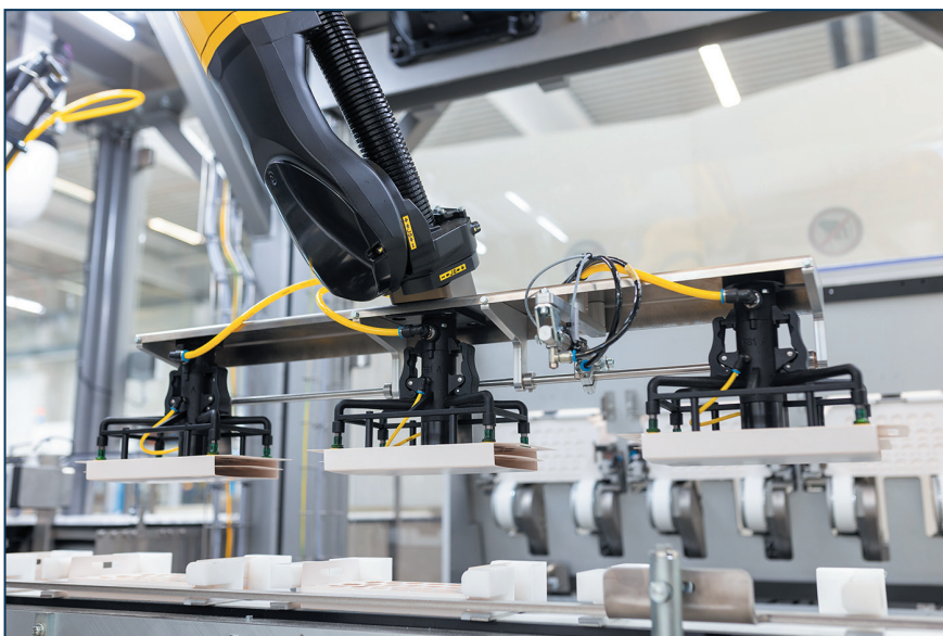
Фото 4. Шестиосьовий робот встановлює картонні вставки