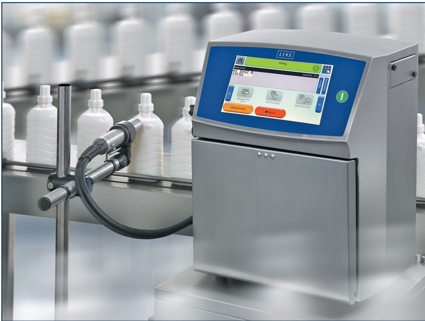
Фото 2. Струменевий принтер Linx 8900 виробництва компанії Bluhm Systeme маркує пластикові контейнери