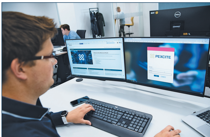
Фото 1. За допомогою програмної платформи Pexcite користувачі можуть збирати, представляти та аналізувати інформацію з усіх етапів процесу виробництва та пакування

Учасники виставки interpack, такі як компанія Uhlmann Systeme, протягом багатьох років розробляють рішення для кодування та маркування фармацевтичної упа-