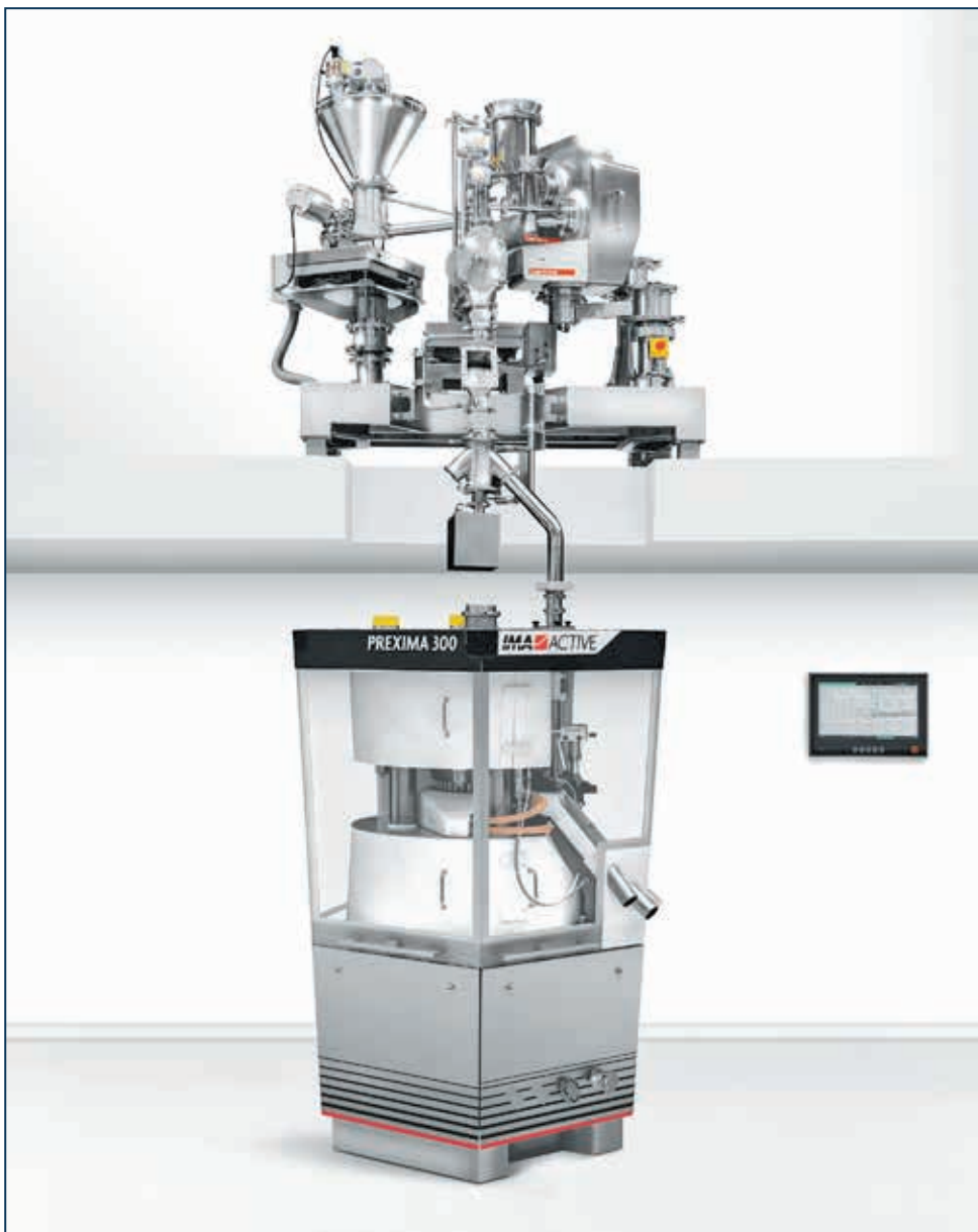
Таблетпрес моделі PREXIMA 300 з міксером

IMA Active пропонує повний спектр обладнання для виробництва твердих лікарських форм для перорального застосування: грануляційне обладнання, машини для таблетування, машини для наповнення капсул з широким спектром систем наповнення і контролю, машини для нанесення оболонки на капсули і таблетки, машини для зважування капсул і таблеток, системи для транспортування та мийки. Після багаторічних досліджень IMA Active разом з американською компанією CONTINUUS Pharmaceuticals також зробила кроки і в сфері безперервного виробництва. Команди дослідників і розробників компаній переосмислили сучасні технології щодо концепції безперервного виробництва традиційних твердих лікарських форм. У травні 2021 р. IMA завершила процес придбання американської компанії Thomas Engineering (тепер Thomas Processing), лідера в секторі нанесення покриттів з більш ніж 50-річною історією. Thomas Processing має на меті стати закордонним центром передового досвіду з нанесення покриттів під егідою IMA Active.