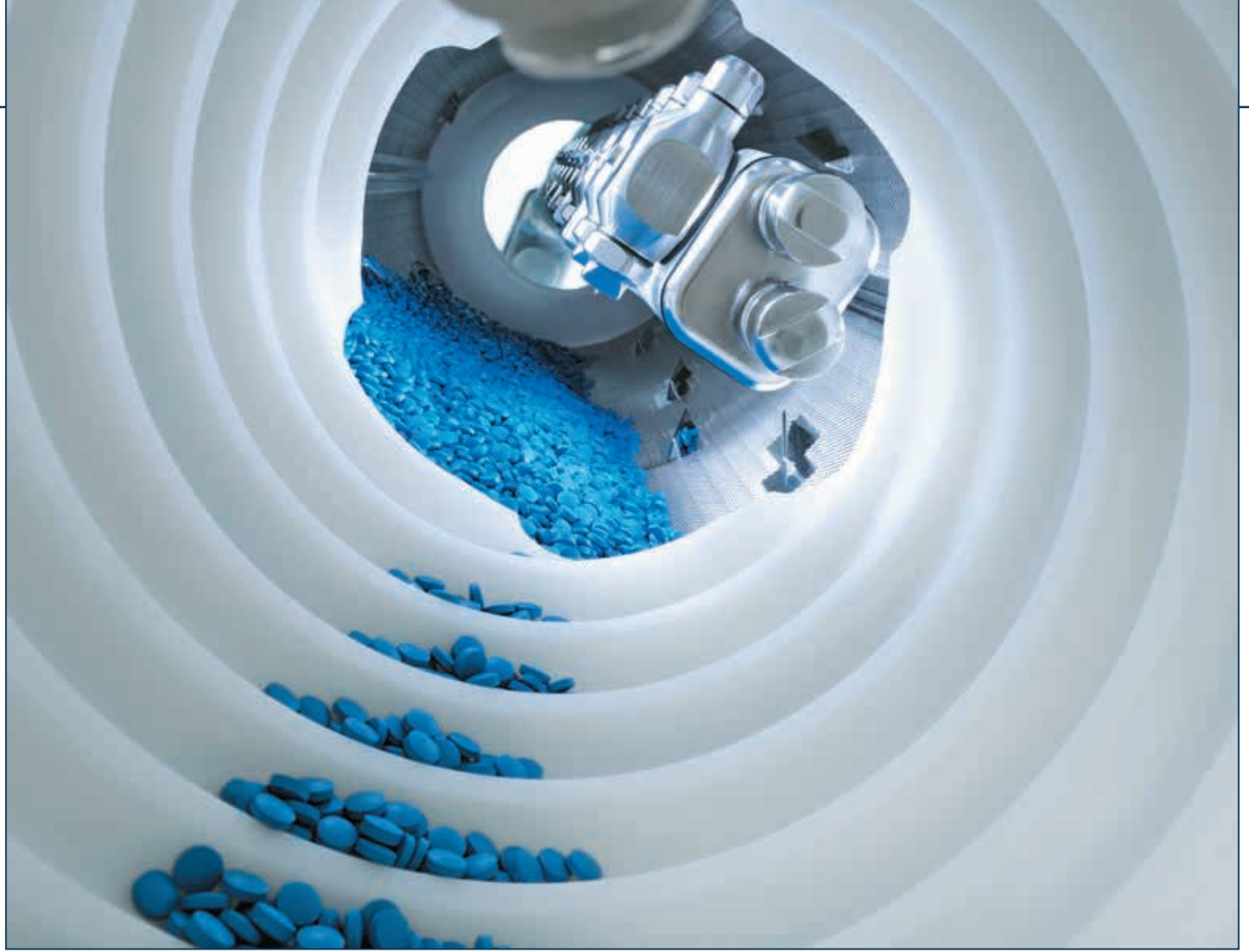
Коатер моделі CROMA для безперервного нанесення покриття на таблетки