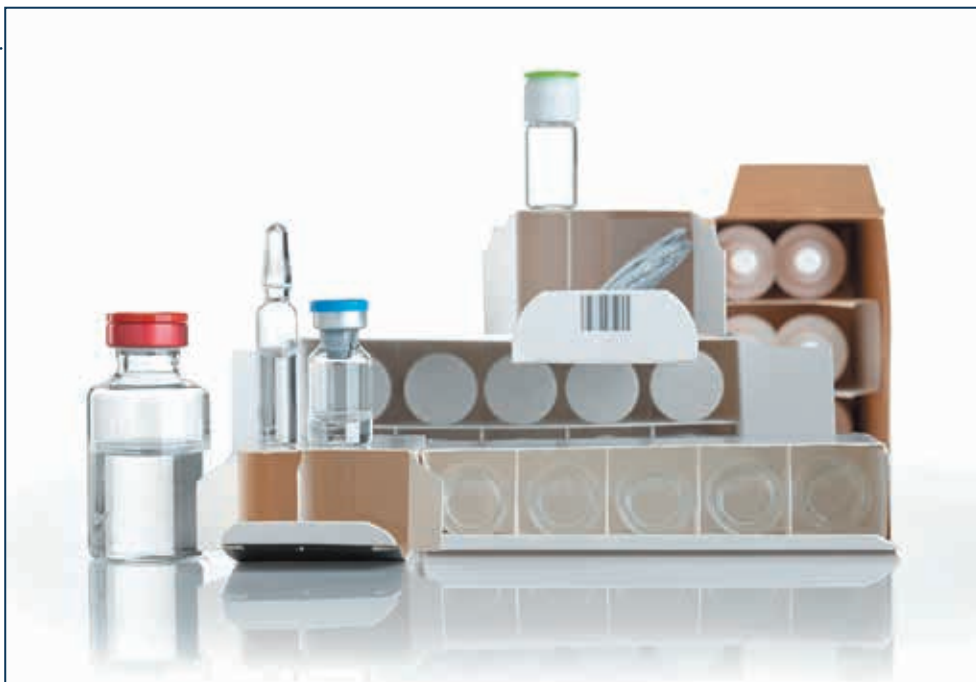
Інноваційні технології вторинного пакування в повністю картонну упаковку і на піддони