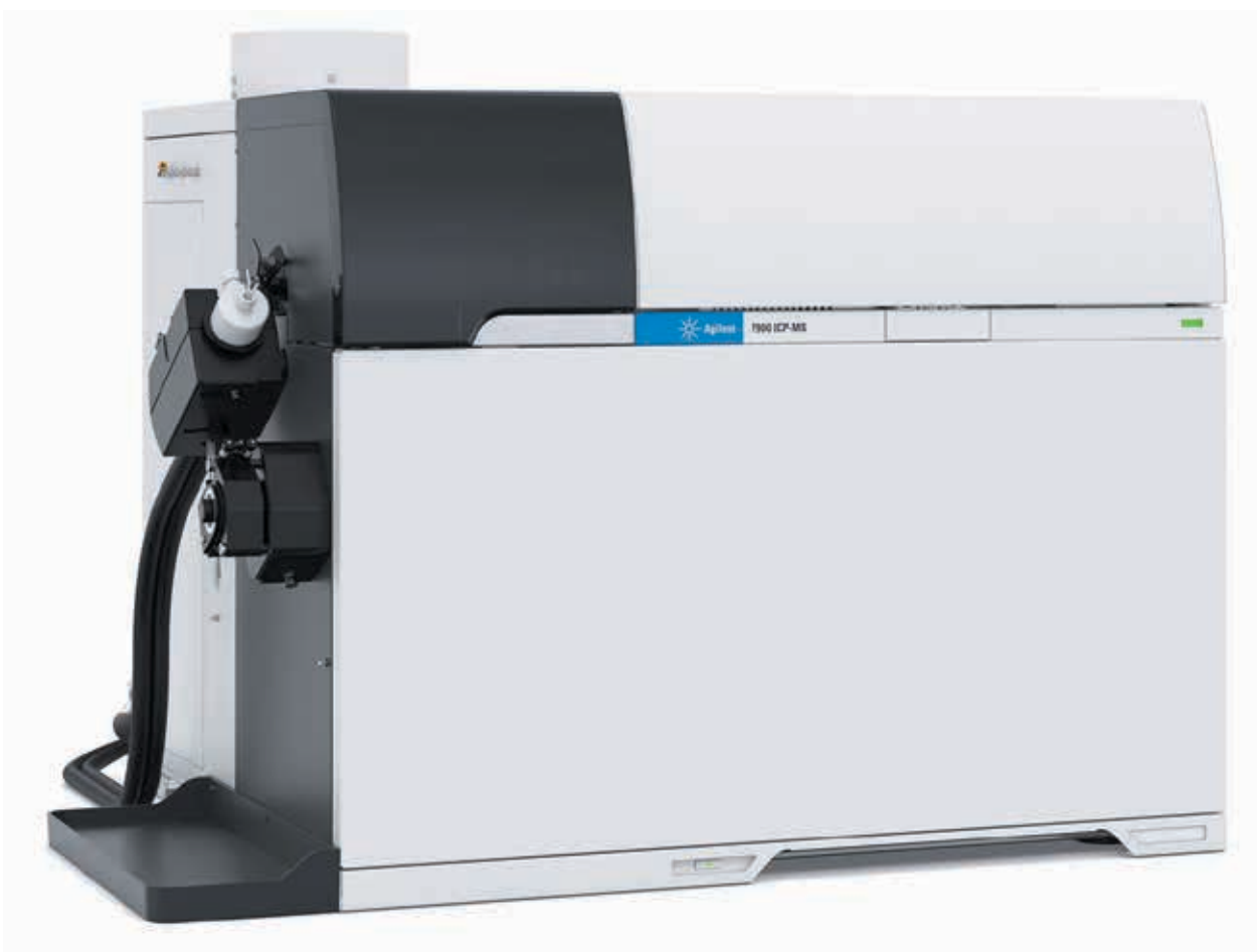
Рис. 1. Мас-спектрометр з індуктивно зв'язаною плазмою Agilent 7900 ІЗП-МС з октопольною коміркою четвертого покоління дозволяє визначати неорганічні домішки у концентраціях на рівні ppt і нижче

Первинна фармацевтична упаковка та системи доставки ліків безпосередньо контактують з лікарською формою, тому завжди існує ризик її забруднення. Останнім часом тема ідентифікації екстрагованих і вилужених ( Extractables and Leachables — E&L ) речовин стала все більше цікавити професіоналів галузі, про