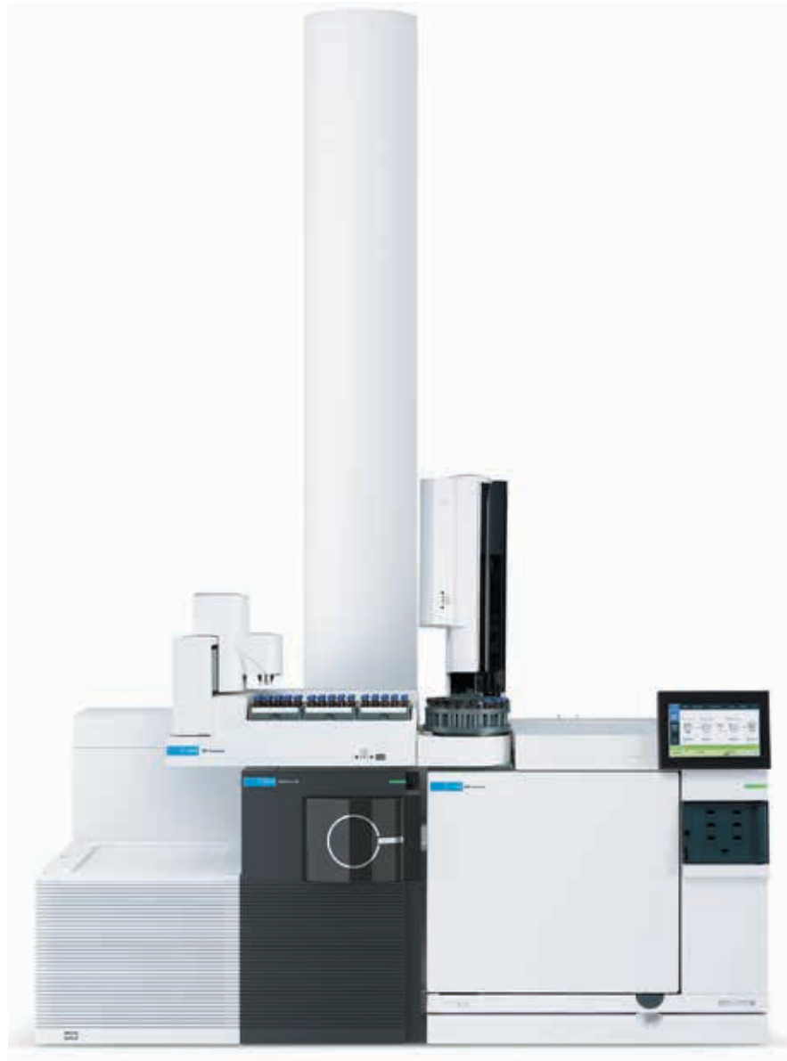
Рис. 2. Тандемний квадрупольно-часопролітний детектор високої роздільної здатності Agilent 7250 Q-TOF для газового хроматографа — найкращий вибір для ідентифікації летких компонентів, що екстрагуються і вилужуються

Аналіз летких компонентів зазвичай здійснюють за допомогою газової хроматографії із мас-селективним детектуванням (ГХ-МС). Мас-спектрометричні аналізатори квадрупольного типу дозволяють проводити ідентифікацію за бібліотеками мас-спектрів. Проте, якщо йдеться про ідентифікацію невідомих компонентів у слідових кількостях, якість мас-спектра може бути недостатньою для ідентифікації. Тому для вирішення таких завдань рекомендують за можливості використовувати тандемний квадрупольно-часопролітний детектор високої роздільної здатності (Q-TOF). Зменшуючи енергію іонізації, можна збільшити ймовірність отриман-