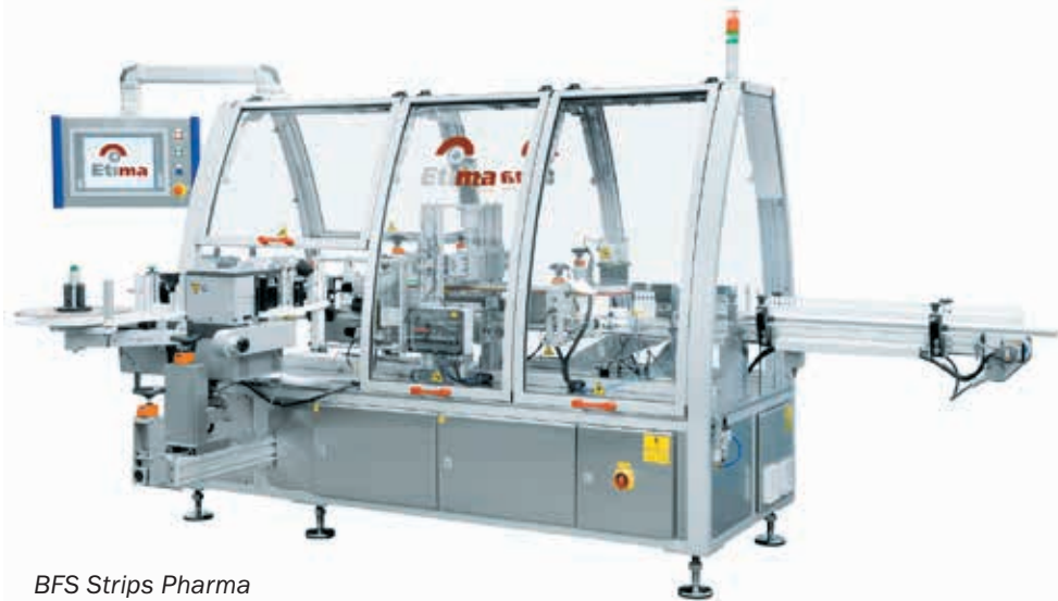
BFS Strips Pharma

І нарешті, лінія S-Spin Pharma — це рішення, яке забезпечує швидкість маркування до 500 одиниць за 1 хв залежно від формату. Має дуже компактні розміри та можливість інтеграції у виробничу лінію.